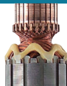
Barniz satinado de recubrimiento en Zig-zag

Cuenta con un cuerpo delgado y un barniz satinado en zig-zag en el inducido que lo protege del polvo externo a diferencia de sus predecesores que contaban con un barniz de recubrimiento en polvo.