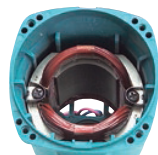
Barniz de recubrimiento en polvo.