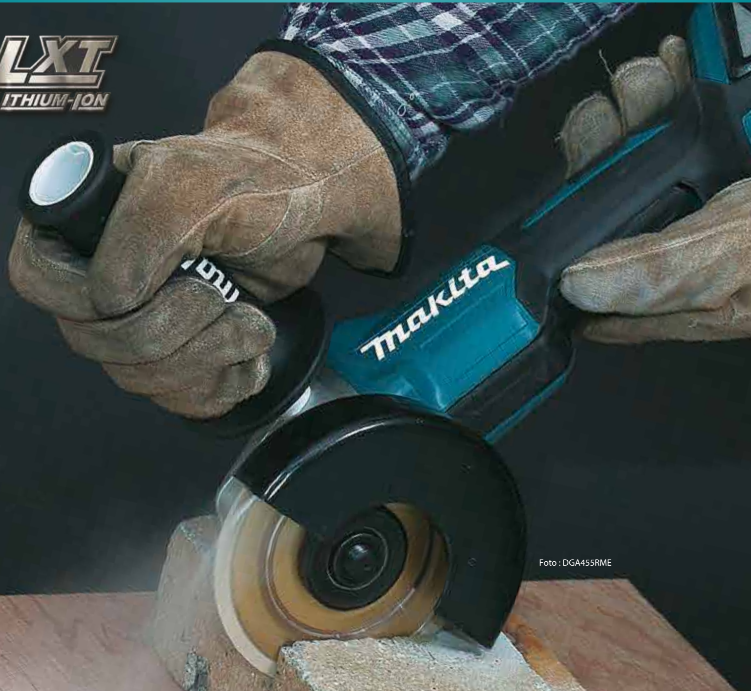
Foto : DGA455RME

Excelente rendimiento tan poderosa como un modelo AC