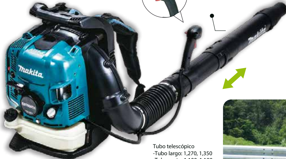
Foto : EB7650TH

Tubo telescópico -Tubo largo: 1,270, 1,350 -Tubo corto: 1,100, 1,180 (opcional)