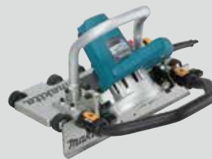
4100NH2R Base de rodillos