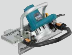
4100NH2W Base de corte húmeda